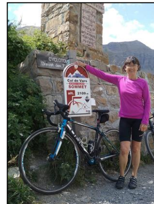
Le col de Vars à plus de 70 ans ... respect !