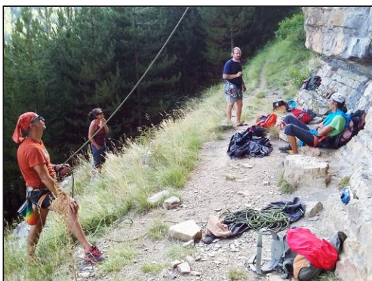
Escalade au Ponteil