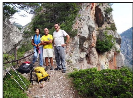
Rando au col de l'Aiguille