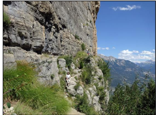
Escalade au Ponteil