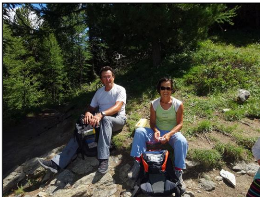
Randonnée au Grand Morgon