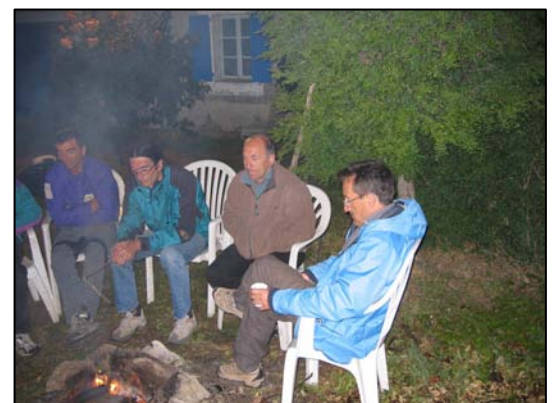
A droite En 2006 au camp d'été