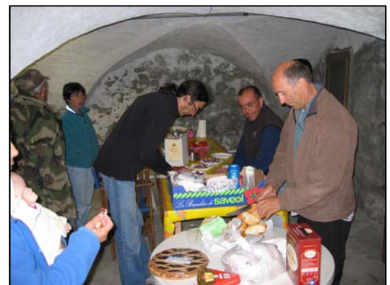
A droite Petite fête en 2006