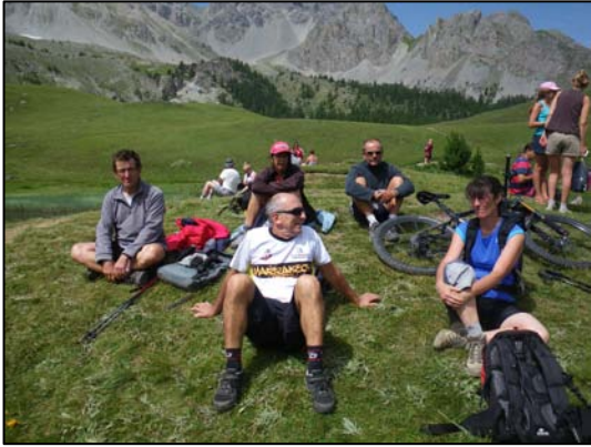
A gauche : Rando à Ceillac en 2013