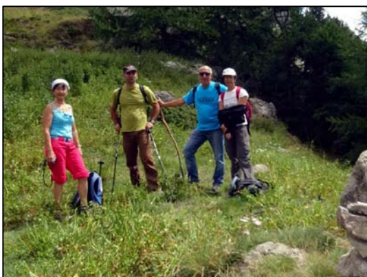
A gauche Rando en 2014