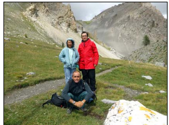
Rando dans le Queyras