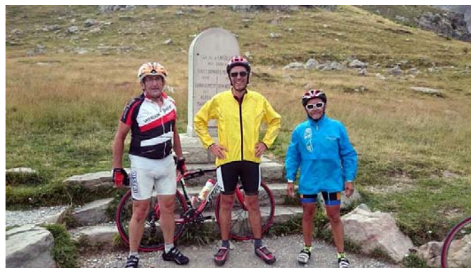
Les 3 cols (Allos – Les Champs – Cayolle) ... Pour 3 générations de Hot Rockers