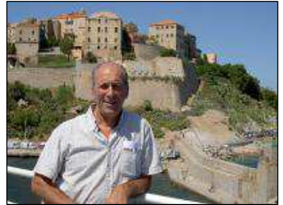
A droite : Sa photo sur le profil FFME