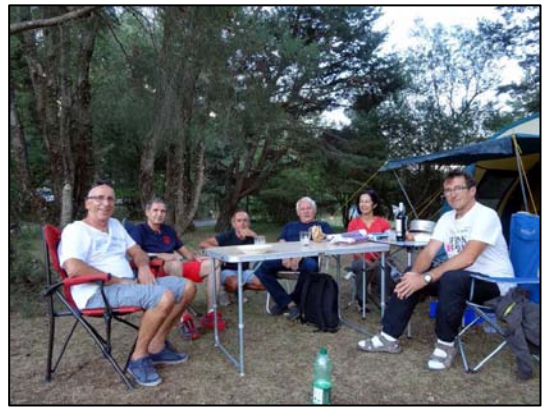
Repas au camp