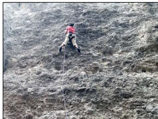
Escalade à Plampinet et Mont dauphin