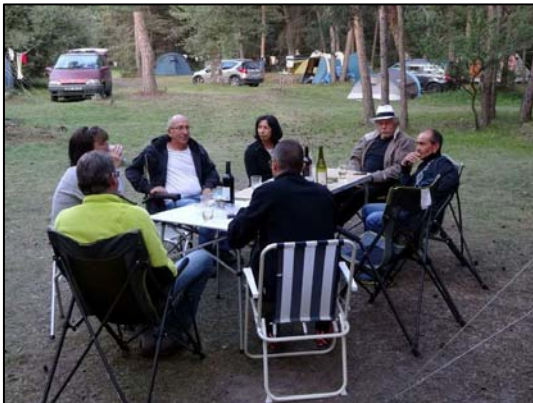
Gauche camp d'été en 2014