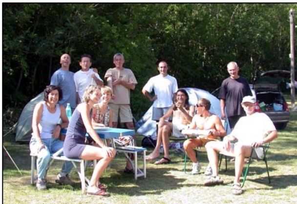
A gauche En 2002 aux vigneaux