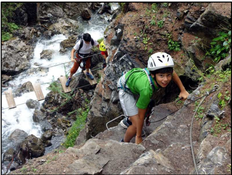
Via ferrata Pour les enfants