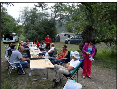
Repas au camp