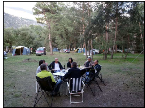
Apéro du soir au camp