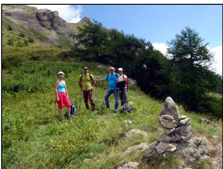
Rando via ferrata