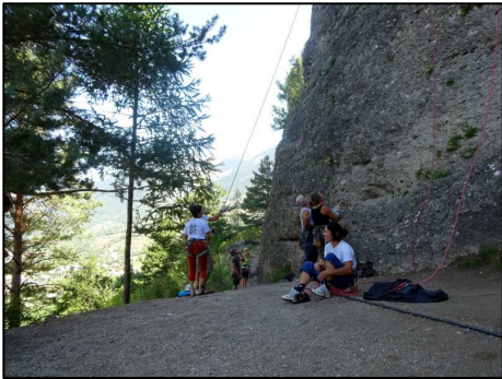
Escalade à Mont dauphin