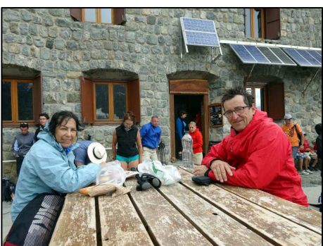
Glacier Blanc Secteur des Lyonnais