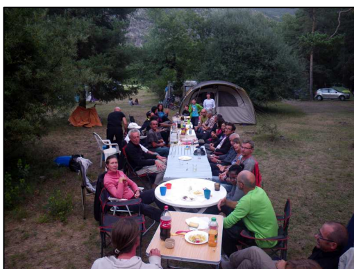
La fête le soir