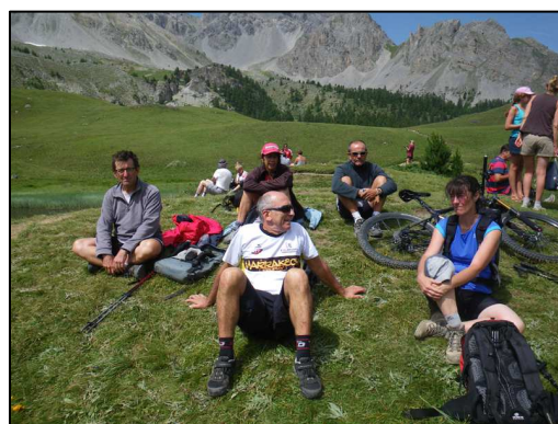
De la rando