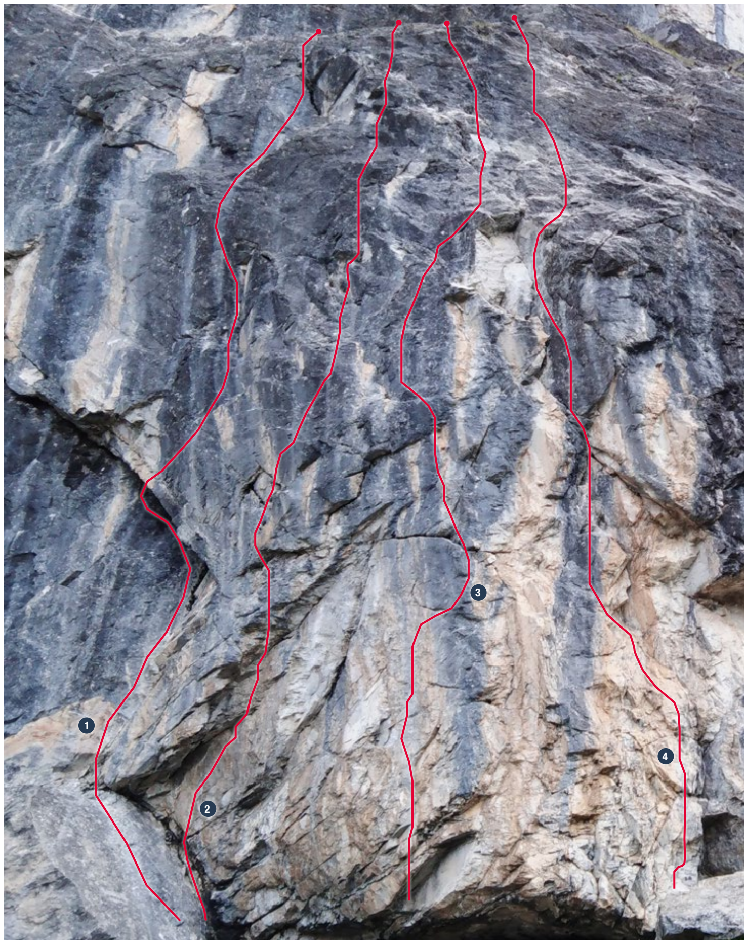
❶ Enduits d'erreurs • 7a